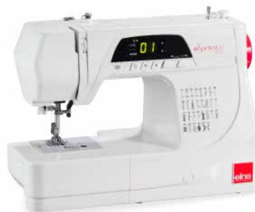
MÁQUINA DE COSER ELECTRÓNICA